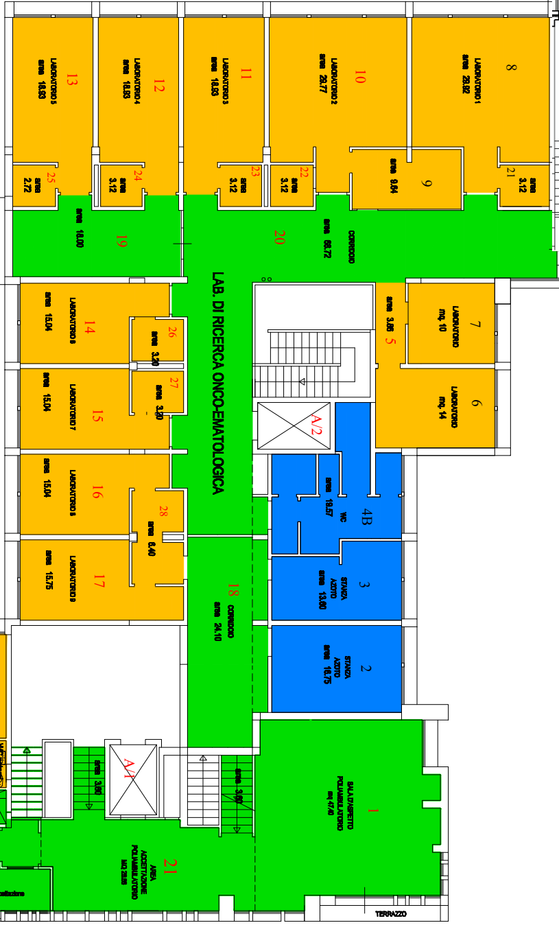
PIANO PRIMO palazzina II