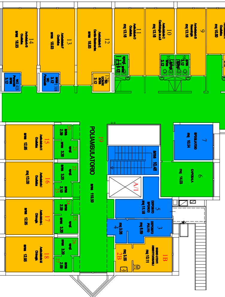
PIANO PRIMO palazzina I